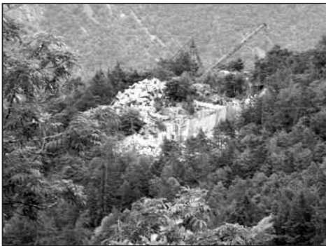
Située à quelques centaines de mètres à vol d'oiseau du hameau des Granges, la carrière de la Plane voit son destin pendu à un test de bruit. LE NOUVELLISTE